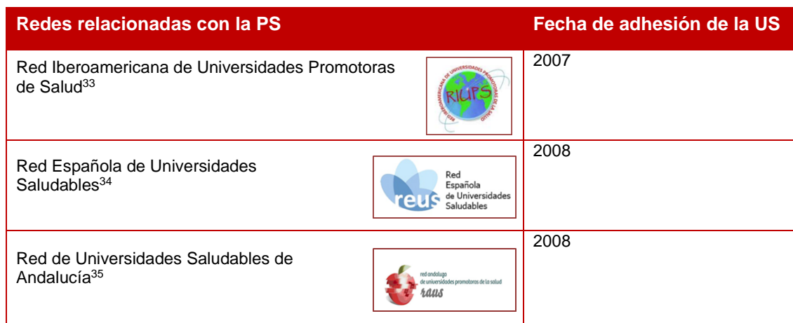
Tabla 6. Redes relacionadas con la promoción de la salud