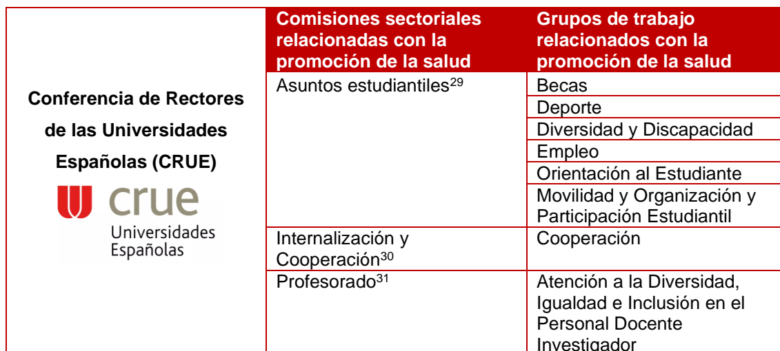
Tabla 5. Órganos externos y grupos de trabajos en los que participa la US y que están relacionados con la promoción de la salud. Elaboración propia a partir de la información disponible en la página web de la CRUE 28